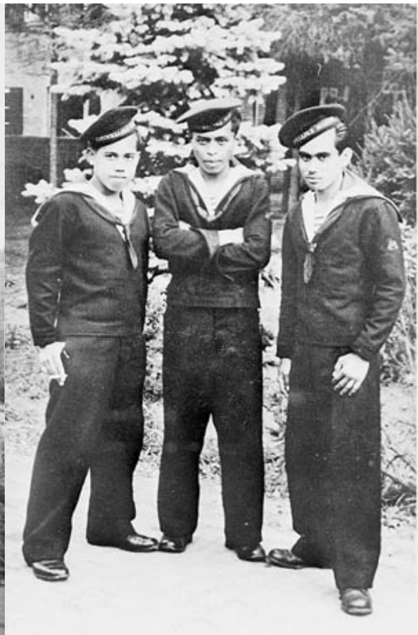
Links: Marinegezin in Bergen (Noord-Holland)