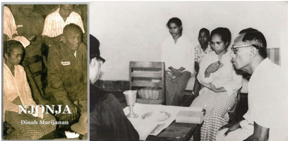
Rechts: Laatste Avondmaal van Soumokil

In katong batja/wij lezen zetten wij voor u nieuwe publicaties, die relevant zijn voor het Molukse verhaal, op een rij. Met enige regelmaat geven we een korte beschrijving van recente artikelen, boeken of films, video's of multimediale publicaties. Het zijn publicaties die gaan over Molukkers in Nederland, over de Molukken of over zaken die belangrijk zijn voor Molukkers. Het gaat zowel om fictie als non-fictie, populair en wetenschappelijk, verschenen bij uitgeverijen of in eigen beheer, zowel in het Nederlands als in het Maleis, Indonesisch of Engels.