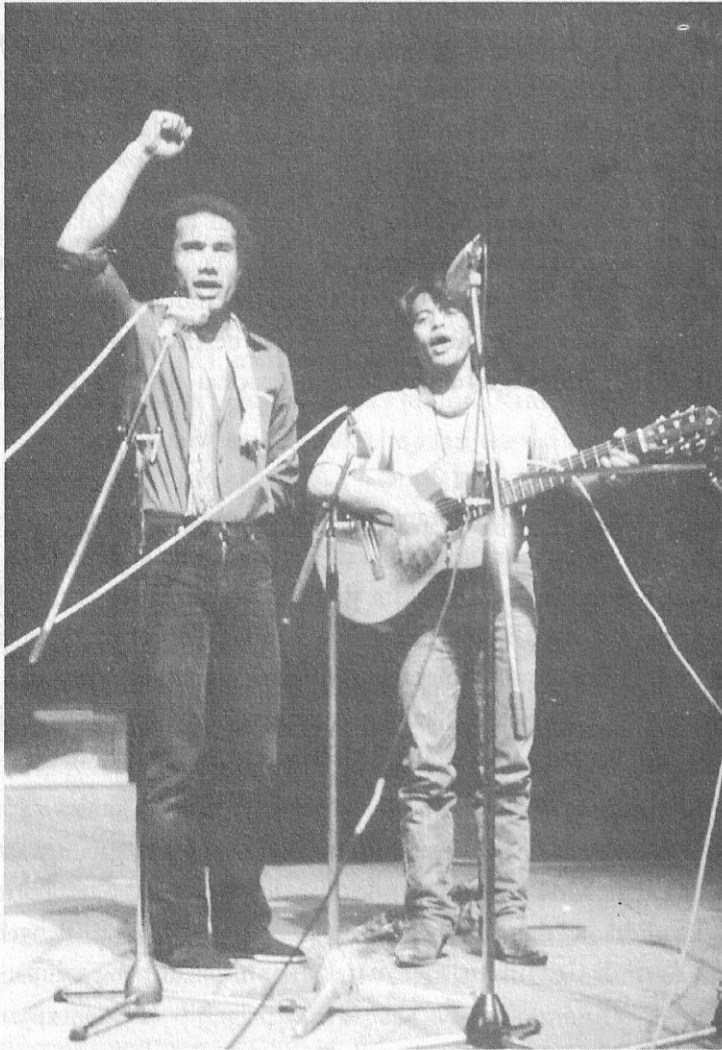
Citra 14.3 Menyanyikan anthem sosialis 'Internationale' di Vrije Universiteit, Amsterdam 1980.

(sebuah band Maluku terkenal) dan pemusik-pemusik Maluku lain, tidak benar-benar menggarap budaya mereka sendiri. Grup dari Zeeland ini melakukannya. Tidaklah sia-sia kami mengundang mereka ke pertemuan kami bulan April silam, untuk mengantisipasi pemilihan umum di Indonesia. Dengan mengundang H-gang, kita tunjukkan bagaimana membuang sikap-sikap tradisional. 252