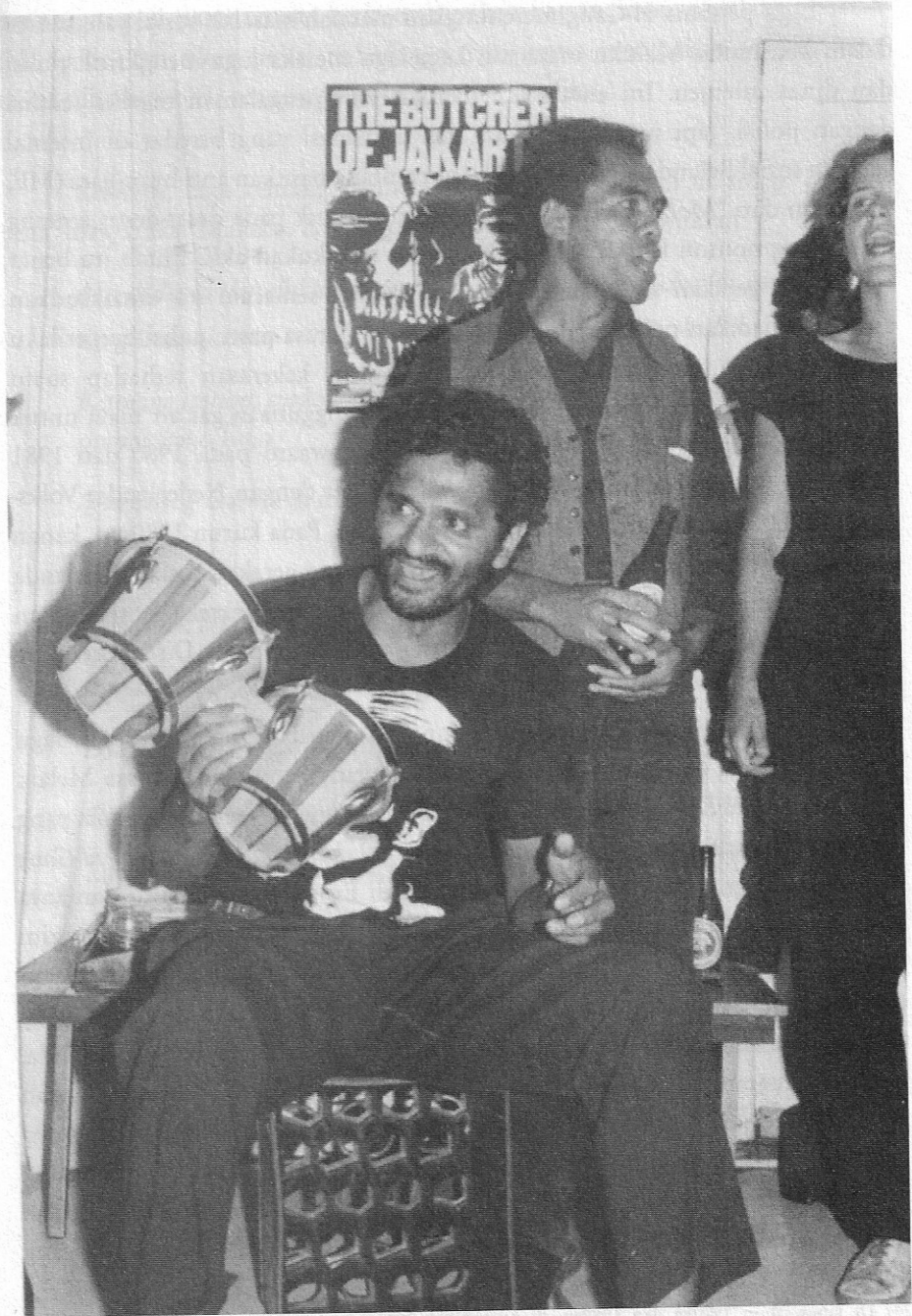
Citra 14.1 Anggota-anggota H-Gang dan Paduan Suara Bintang Merah pada suatu pesta pribadi, 1984.